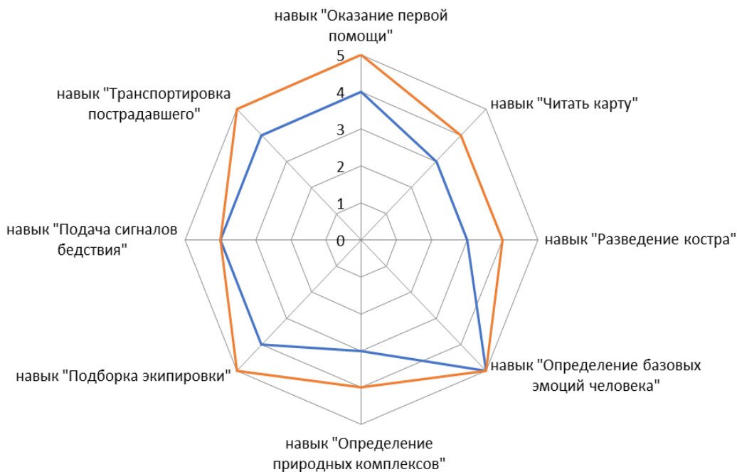
Диаграмма жестких навыков* компетенции «Личная безопасность» показывает уровень владения Вами определенных навыков. Степень владения навыками проводилась Вами самостоятельно по 5 бальной шкале. Чем больше значение оценки навыка, тем более Вы им владеете.

Синей линией показано уровень навыка, который Вами был определен на начало обучения в интенсивной школе. Красной линией – зафиксированный Вами уровень навыка после обучения на интенсивной школе. На диаграмме хорошо видно, над какими навыками Вам необходимо поработать и определить путь развития навыка.